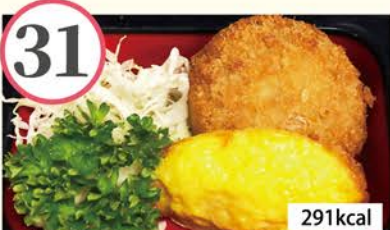
ハムカツ チーズオムレツ、ナポリタン