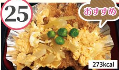
ひれかつ玉子とじ ピーマンとひき肉のオイスター炒め、切昆布の煮物