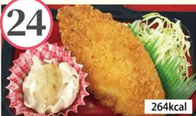
白身魚フライ 肉焼売、焼きピーマン