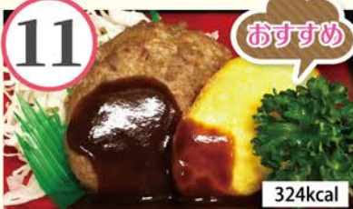
チーズinハンバーグ オムレツ、ペンネナポリタン