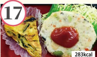
豆腐ハンバーグ ベイクドエッグ、ひじき煮