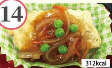
とり天野菜あんかけ ウイナーチーズ串フライ、キャベツのカレー炒め