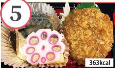
キーマカレーコロケ サバ塩焼き、金平ごぼう