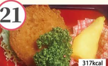
クリーミーコロケ(トマトバジル) 玉子ロール、マカロニときのこの炒め物