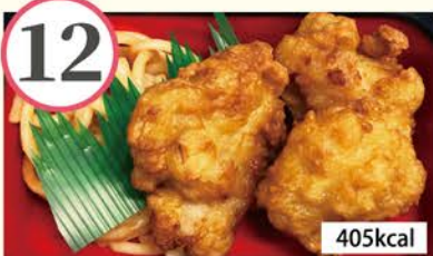
鶏もも唐揚げ 切干大根煮、おひたし