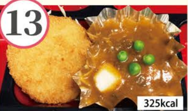
メンチカツ かぼちゃカレー、切昆布の煮物