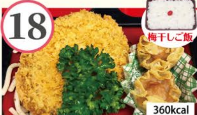
キャベツメンチカツ 肉焼売、ブロッコリーの玉子とじ