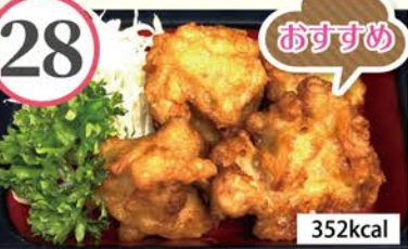
鶏もも唐揚げ ごぼうの甘辛煮、切干大根カレー炒め