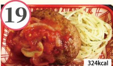
ハンバーグきのこトマトソース チンゲン菜の煮びたし、じゃがいも串フライ