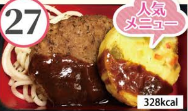
ハンバーグデミソース スパニッシュオムレツ、五目豆煮