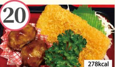
イカフライ 肉団子照焼き、春雨中華サラダ