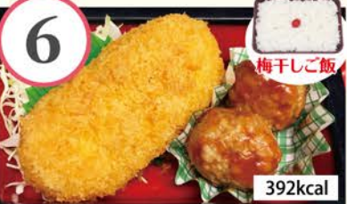
ささみフライ 肉団子ケチャップあん、春雨とツナのサラダ