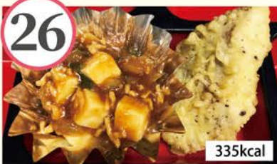
麻婆豆腐 赤魚の天ぷら、キャベツの中華風煮びたし