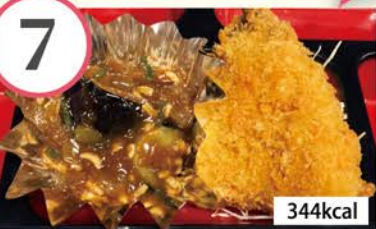
あじフライ 麻婆茄子、キャベツの味噌炒め